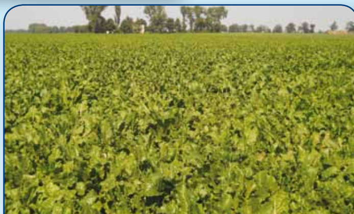
Lekko żółtawe przebarwienie liści na plantacji na przełomie sierpnia i września oznacza, że buraki dojrzewają i aktywnie gromadzą w korzeniach cukier

W lipcu i sierpniu okresy upalne i słoneczne przeplatały się z dniami deszczowymi. Nie brakowało gwałtownych i ulewnych opadów burzowych. Masa