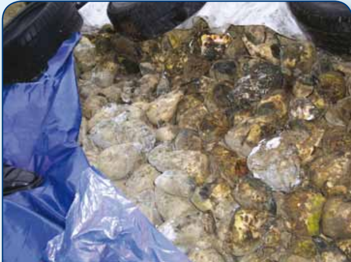
Okrycie buraków innymi materiałami niż zalecana włóknina (folie, plandeki, liście) powoduje przegrzanie korzeni, rozwój chorób grzybowych i procesów gnilnych, i dlatego jest niedopuszczalne

Pryzma powinna być okryta możliwie szybko, po starannym uformowaniu i lekkim wychłodzeniu. Nie wolno zwlekać z okryciem buraków, jeśli spodziewane są ulewne opady, opady śniegu lub nadejście mrozów. Do umocowania włókniny na pryzmie można zastosować stare opony, a przy zapowiadanych niskich temperaturach warto dolną partię pryzmy okryć balotami słomy, aby nie dopuścić do przemarznięcia pryzmy na styku z ziemią. Przykrycie pryzmy należy niezwłocznie zgłosić do działu surowcowego cukrowni. Włóknina powinna być usunięta dopiero bezpośrednio przed odstawą buraków.