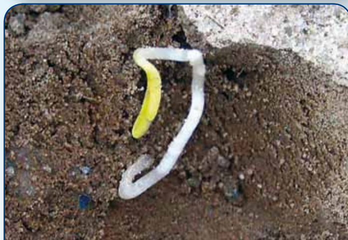
Przy wystąpieniu gwałtownych wiosennych opadów nadmierne rozpylenie gleby może doprowadzić do utworzenia skorupy glebowej stawiającej mechaniczny opór kiełkującym nasionom