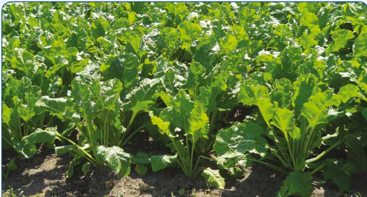
Na dobrych plantacjach już w połowie czerwca buraki zakryły międzyrzędzia

Wydłużony, dzięki wczesnym siewom, okres wegetacji oraz korzystne dla wzrostu buraków i gromadzenia cukru w korzeniach warunki atmosferyczne pod koniec lata, pozwalają bardzo optymistycznie szacować wysoki plon buraków i spodziewać się jego dobrej jakości.