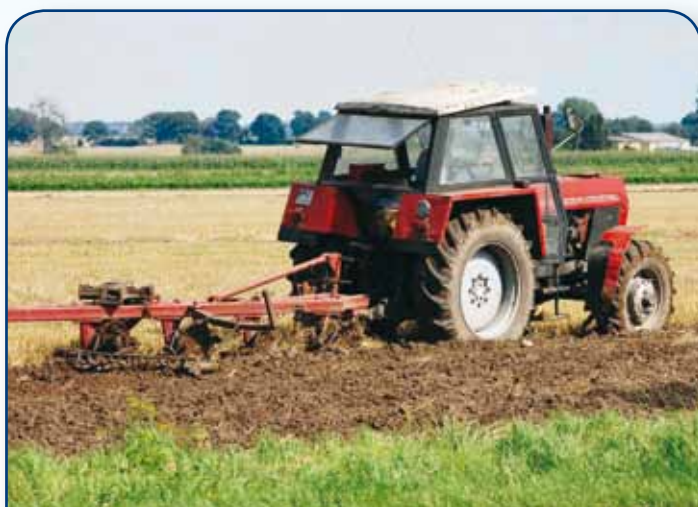
Uprawa ścierniska przerywa parowanie wody z gleby, przyspiesza kiełkowanie chwastów i rozkład resztek późniowych