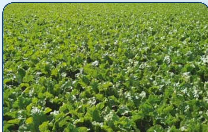
Cieszymy się, iż uprawa buraków cukrowych jest nadal opłacalna dla naszych Plantatorów

W związku z tym, na kolejną kampanię planujcie Państwo również bezpiecznie i realnie powierzchnie uprawy, bo nasza strategia w tym zakresie się nie zmieniła.