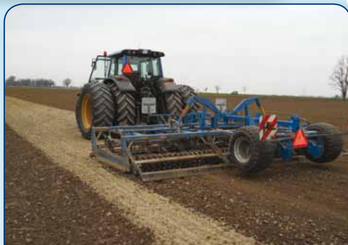
Agregat do uprawy przedwiosennej gwarantuje odpowiednie przygotowanie gleby do siewu i optymalne warunki do wschodów roślin