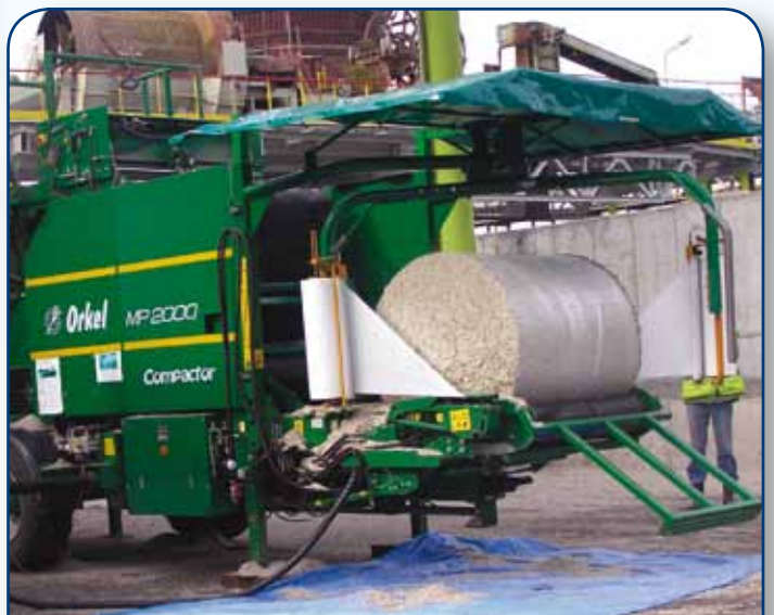
Prasa do belowania wystodków z owijką jest maszyną o stosunkowo niewielkich rozmiarach, które ułatwiają wykonanie usługi na placu w cukrowni

Usługa belowania wystodków wykonywana jest za pośrednictwem cukrowni. Wystodki kierowane są do prasy belującej bezpośrednio z produkcji, co