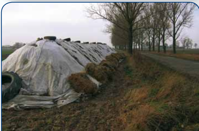
Prawidłowo okryta pryzma, złożona przy przejeździej drodze, umożliwi odbiór surowca o dobrej jakości również w trudniejszych warunkach pogodowych

Do przechowywania w pryzmach powinny być kierowane tylko buraki zdrowe, prawidłowo ogłowione, wolne od chorób i uszkodzeń mechanicznych. Pamiętajmy, że prawidłowe i terminowe okrycie pryzm buraczanych zalecaną włókniną, jest jedynym zabezpieczeniem jakości buraków oraz niezbędnym elementem w procesie produkcji surowca, szczególnie ważnym w obliczu wydłużających się kampanii buraczanych!